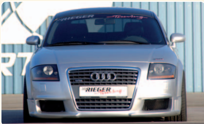
Abb. ohne 3 zusätzliche mittige Lüftungsschlitze

Seitenschweller auch in CARBON-LOOK lieferbar.