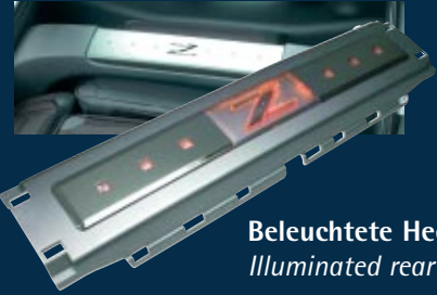
Beleuchtete Heckleiste Illuminated rear panel