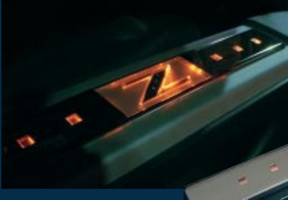
Beleuchtete Einstiegsleisten Illuminated entrance panels