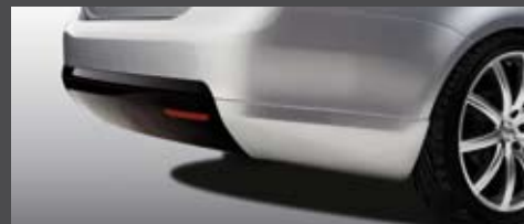
Spoiler arrière en deux parties Achterbumperspoiler in twee delen Heckschürze in zwei Teilen Rear spoiler in two parts