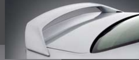
Becquet de coffre «Sport» Kofferspoiler «Sport» «Sport» Heckspoiler «Sport» boot spoiler