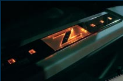
Beleuchtete Einstiegsleisten Illuminated entrance panels